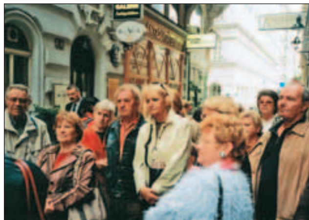
Stadtspaziergang zum "Vergnügen im alten Wien" am 20. September 2007.