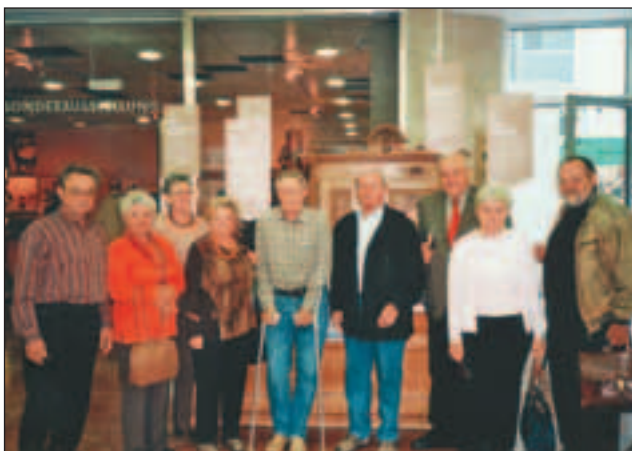
Besuch im Wien Museum am Karlsplatz "Im Wirtshaus" am 11. September 2007.

Anmeldungen bei den Funktionären des Pensionistenverbandes.