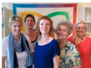
Das LebensRaum Team freut sich auf Ihren Besuch!

Für jeden Termin wählen wir ein bestimmtes Thema, zu dem wir ausführlicher informieren, oft gemeinsam mit ExpertInnen, die wir zu uns einladen. Es gibt jedoch immer ein offenes Ohr und ausreichend Zeit für Ihre Fragen!