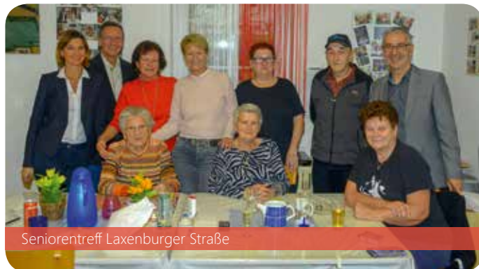
Seniorentreff Laxenburger Straße