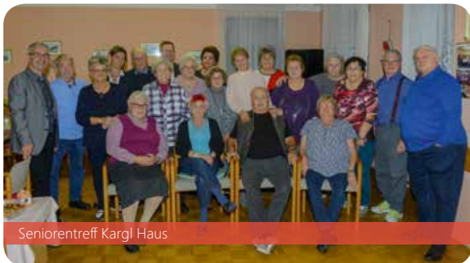
Seniorentreff Kargl Haus