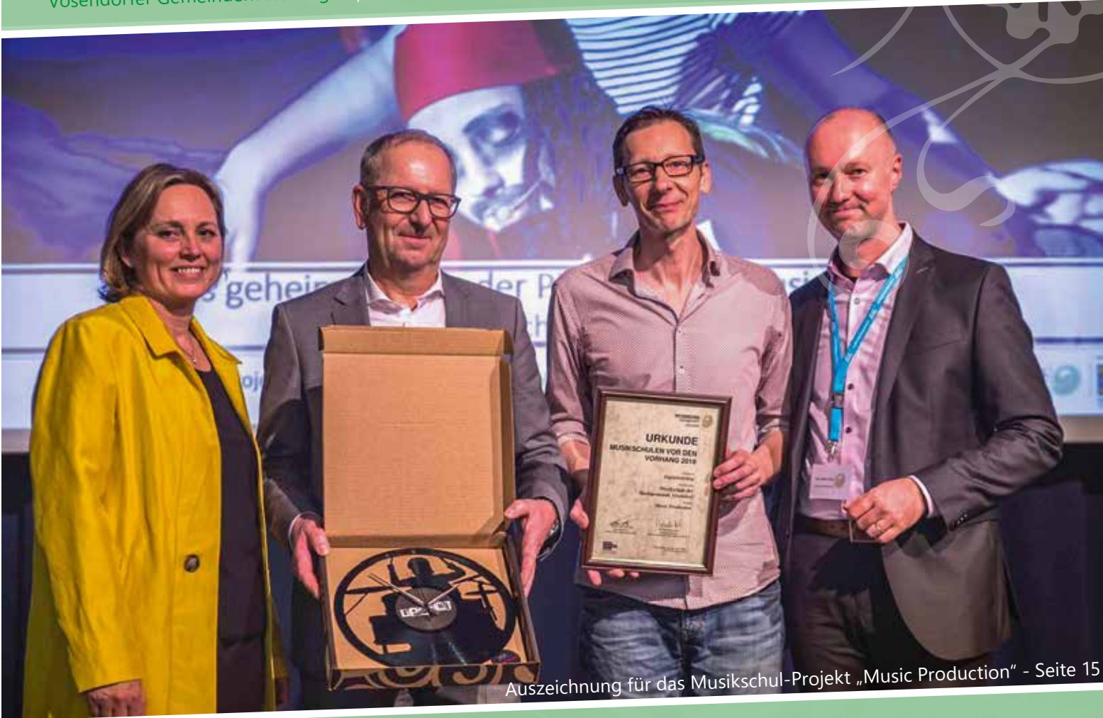
Auszeichnung für das Musikschul-Projekt „Music Production“ - Seite 15

Vösendorfer Gemeindemitteilungen | Informationen - Termine - Berichte - Amtliche Nachrichten