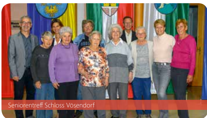
Seniorentreff Schloss Vösendorf