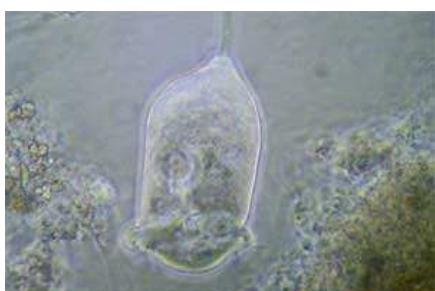
Bild eines „Glockentierchens“ auf einer Belebtschlammflocke in 400facher Vergrößerung.

Rohabwasser wird in einer Siebanlage von Grobstoffen gereinigt und durchläuft einen sogenannten Sandfang . In diesem Bauwerk werden mittransportierter Sand und andere mineralische Stoffe gezielt ausgeschieden. Das Abwasser fließt weiter in ein Vorklärbecken wo sich Stoffe, die schwerer sind als Wasser, absetzen, jene die leichter sind jedoch an die Oberfläche gelangen. Beide werden aus diesem Becken entfernt. Anschließend fließt das nunmehr mechanisch gereinigte Abwasser über einen Quelltopf der es auf zwei Belebungsbecken aufteilt. In diesen werden die verbliebenen Schmutzstoffe unter Zufuhr von Luftsauerstoff durch Mikroorganismen (hauptsächlich Bakterien) abgebaut und bilden dabei sogenannte Schlammflocken. Diese sind wiederum schwerer als Wasser und setzen sich in der nächsten Station, dem Nachklärbecken , ab. An dessen Oberfläche verbleibt das jetzt auch biologisch gereinigte Wasser, welches bei einer Reinigungsleistung von bis zu 99% in den Petersbach geleitet wird.